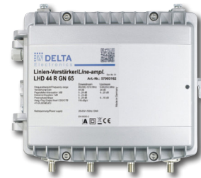
|| FOSTRA-F FSK-RX